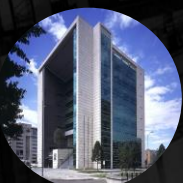
Cámara de Comercio de Bogotá