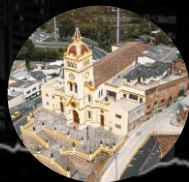
Zona Egipto Localidad de La Candelaria