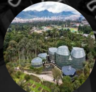
Jardín Botánico de Bogotá

2.500 asistentes, incluyendo participantes de 49 países.