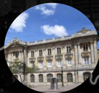
Palacio de San Francisco