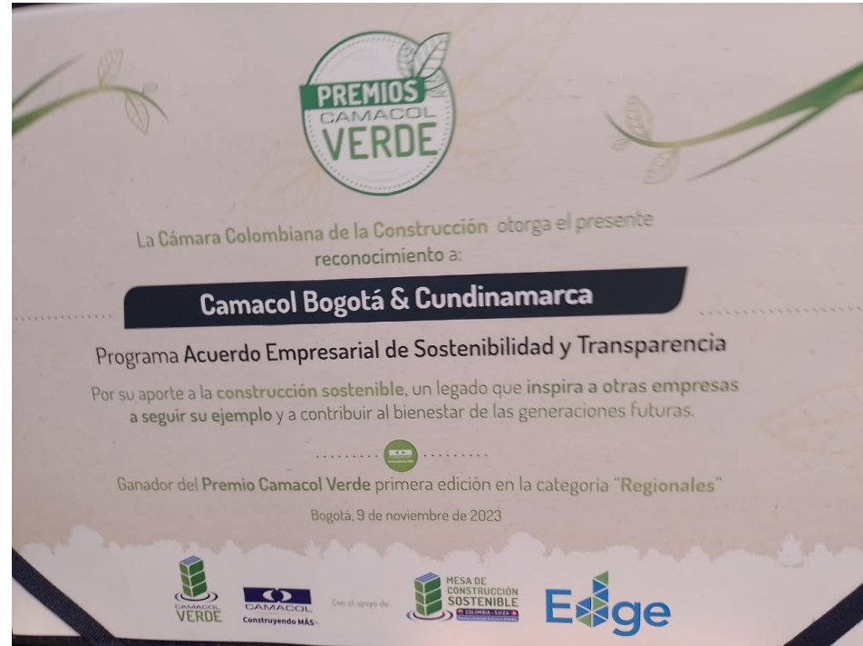
Ganadores del Premio Camacol Verde, en la categoría de Regionales.