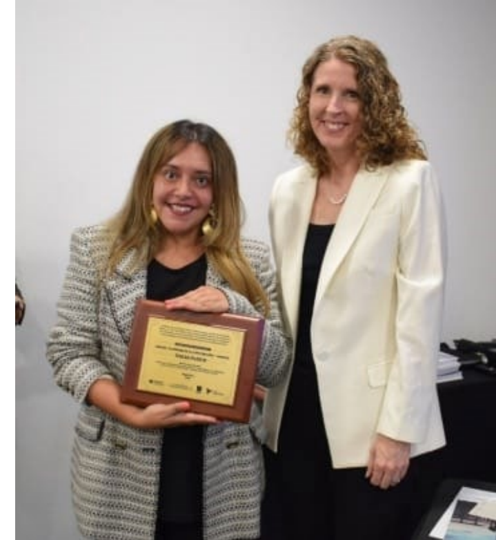
Publicación “Ruta hacia la transparencia: Promoviendo buenas prácticas en el sector de la construcción y la infraestructura en Colombia” de la Oficina de las Naciones Unidas contra la Droga y el Delito (UNDOC) ONUDOC